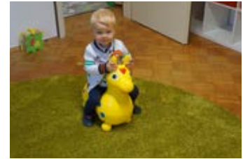
Bequeme Schuhe an und dann ging's gleich aufs Hüpfpferd.