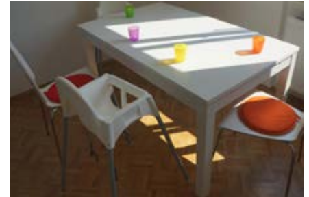
Küche und Essbereich

in den kleineren Bewegungs- bzw. Ruheraum innerhalb dessen die Kleinen nach dem Mittagessen ihr Mittagsschläfchen abhalten können. Nebenan befindet sich die Küche mit einem großen Esstisch.