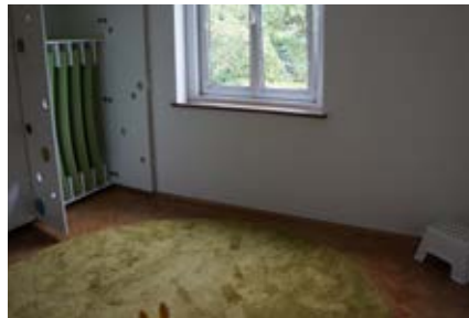
Bewegungs- und Ruheraum

sodass den Kindern garantiert nie langweilig wird. Betritt man das nächste Zimmer, so gelangt man