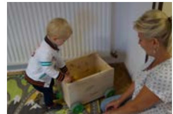
Später waren die Bausteine und die Autokiste interessanter.